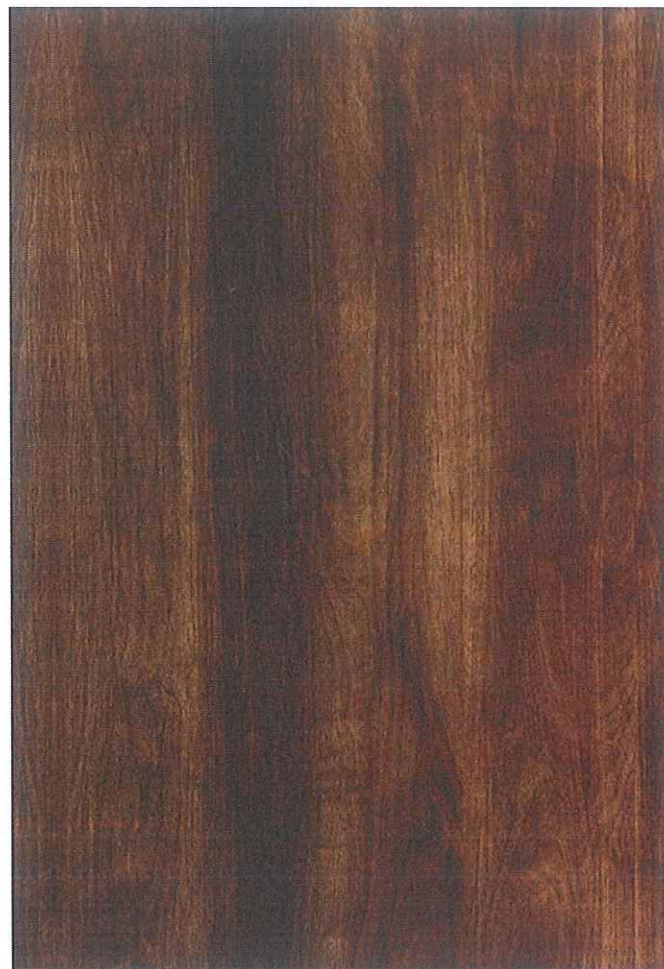
仮囲い木目シート